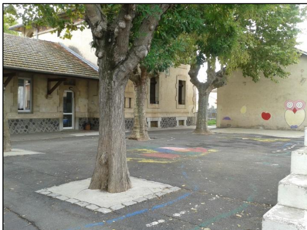
La cour des Petits