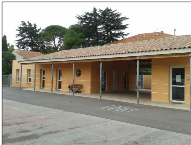
Le préau d'entrée