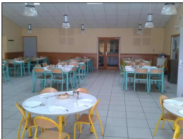
Le restaurant scolaire