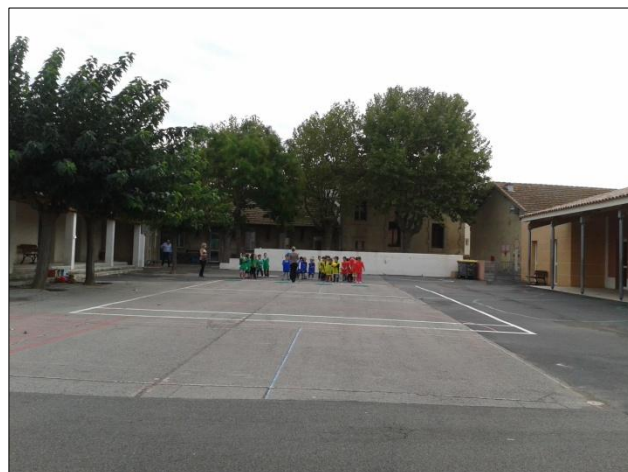
La cour des Grands