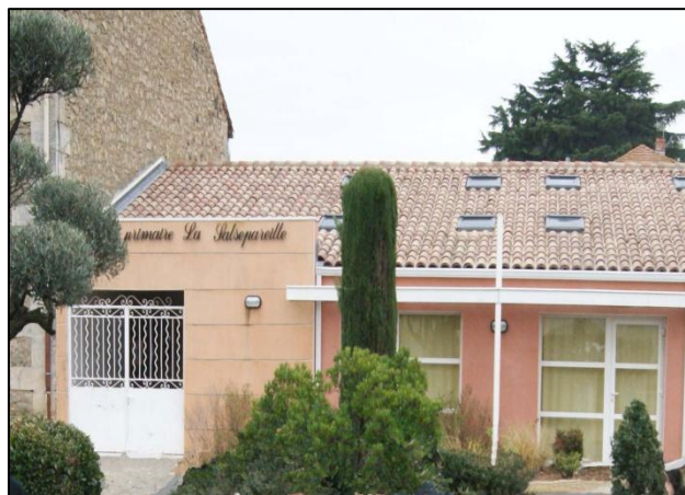
Entrée principale de l'école

Académie de Montpellier : www.ac-montpellier.fr