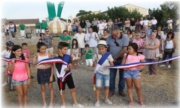
Inauguré le 13 juillet, ça roule sur le PUMP Track qui remporte un important succès.