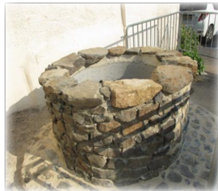
Embellissement du parking de la place du Maréchal-Fer-rant par habillage du puit.