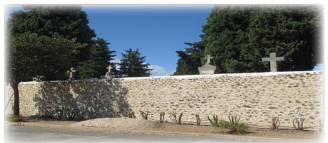
Un tronçon du mur du cimetière rénové.